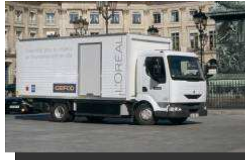
Camion fourgon de 10 tonnes de PTAC Electrique ou GNV