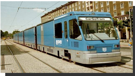
Tramway marchandises Exemple du CarGo Tram de Dresde