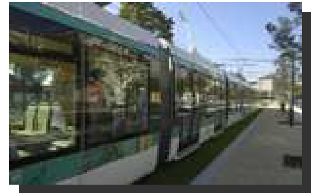
Plate-forme logistique Sogaris de Rungis (94) – T7 - 2014