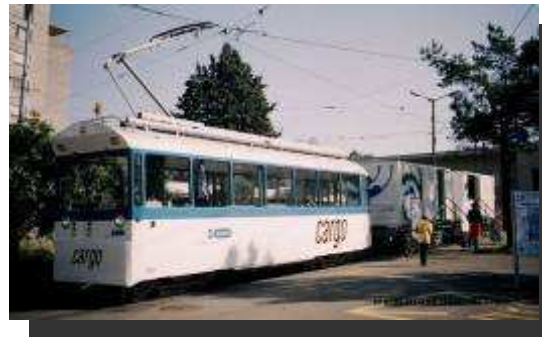
Cargo-Tram de Zurich