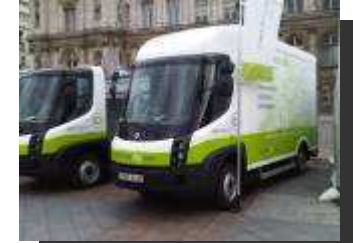
Camion électrique de 5,5 tonnes de PTAC utilisé par les transports DERET pour leur réseau de messagerie urbaine