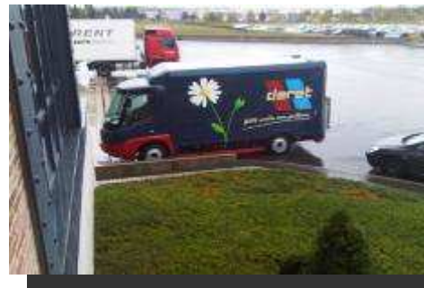
Fourgon électrique MODEC 5,5 tonnes de PTAC