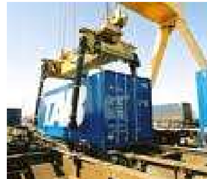
Caisse mobile combiné rail- route