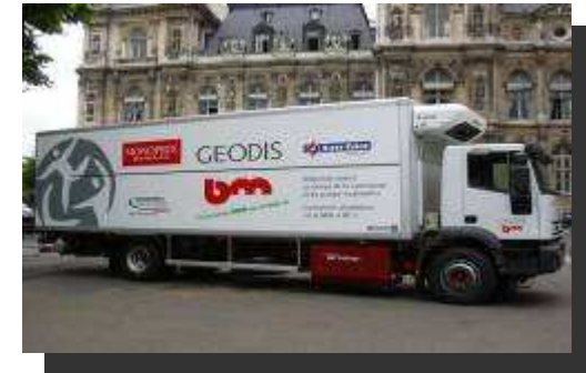
Camion porteur GNV de 19 t ou 26 tonnes de PTAC Chargement de 21 palettes 12 m de long