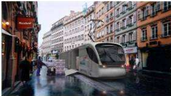
Entrée des marchandises par tramway dans le centre ville

Les marchandises stockées ou en transit sur la plate-forme Sogaris entreront dans le centre ville en tramway et / ou véhicules industriels propres et seront reprises par des véhicules propres de distribution pour être acheminées sur les points de livraison