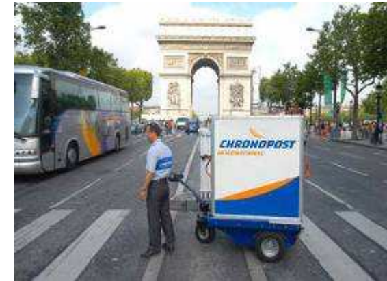
Exemple de l'ELU Concorde CHRONOPOST – Paris 8 ème