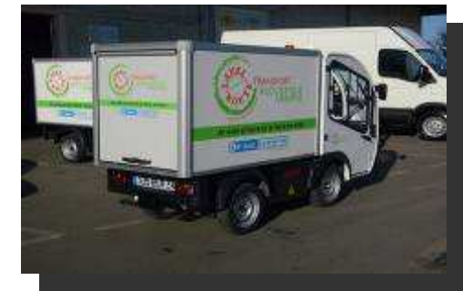
Véhicule utilitaire léger Goupil de 1150 kg de PTAC et 500 kg de CU