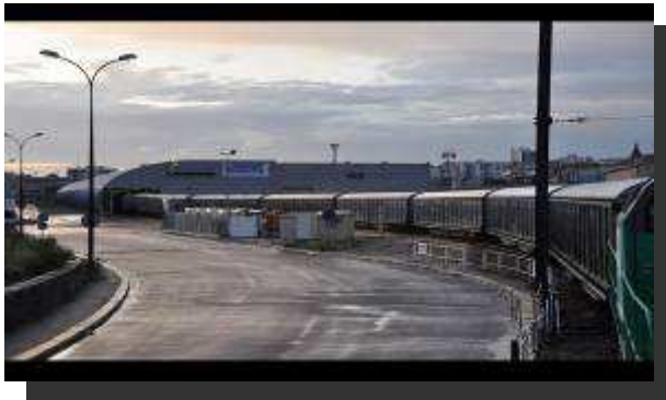
Train grande distribution Exemple du train SAMADA MONOPRIX - 22 wagons

La gestion des flux amonts sera assurée en priorité par la technique ferroviaire à la fois par trains complets, wagons isolés et caisses mobiles combiné rail-route. Les autres flux de longue distance seront gérés en véhicules industriels maxi-code de 40 tonnes de PTAC. Les flux de provenance régionale devraient être assurés en camions porteurs de 19 à 26 tonnes. Ces flux amonts seront massifiés sur de longues distances.