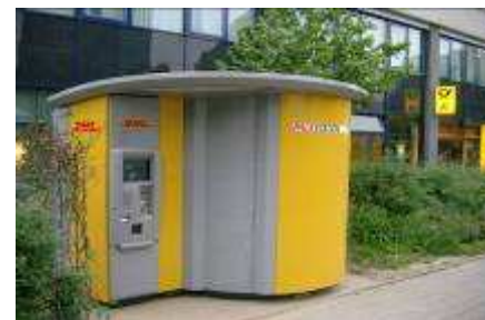
Automates logistiques Exemples :