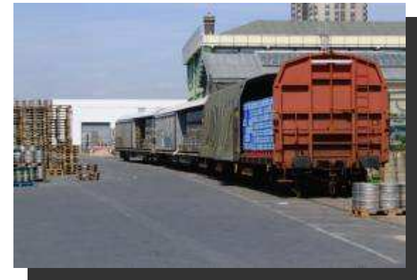
Une entrée massifiée des marchandises dans Paris Train d'eau minérale sur le site de la société TAFANEL – Paris 18 ème arrondissement