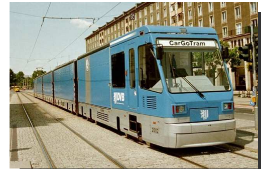
Tram Cargo de DRESDE