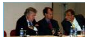
A. JOFFRE / M. IRIGOIN T. LAFFONT