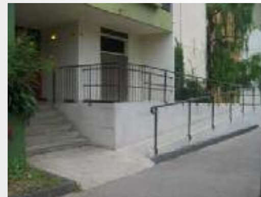
Accessibilité généralisée (sous forme d'appel à projets)