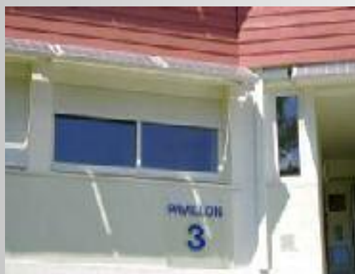
Promotion des énergies renouvelables et de la haute performance énergétique