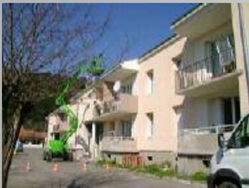
Mobilisation du foncier